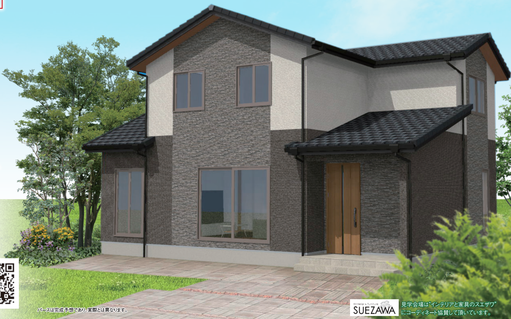
パースは完成予想であり、実際とは異なります。