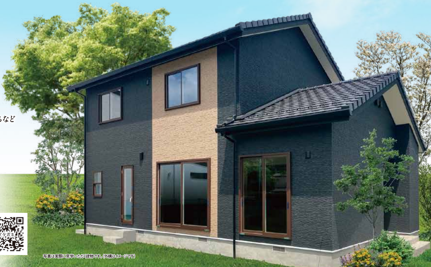
写真は実際に見学いただける建物です。(外構はイメージです)

黒い外壁に木調のアクセントと切妻の瓦屋根が印象的な和モダンの外観。 家族が集う居心地の良いLDKは、約20帖の広々とした空間。 キッチンとサニタリーを隣接し、すぐ横にファミリークローゼットを配置するなど 家事動線をコンパクトにまとめた共働きのご夫婦にやさしいプランニング。 リビング横の和室は、家事スペースやゲストルームなど多目的に利用可能。 水廻りや子供部屋など、すべてのスペースにゆとりを設けた 子育て世代が建てた見どころ満載の家事ラクの住まいが完成しました。