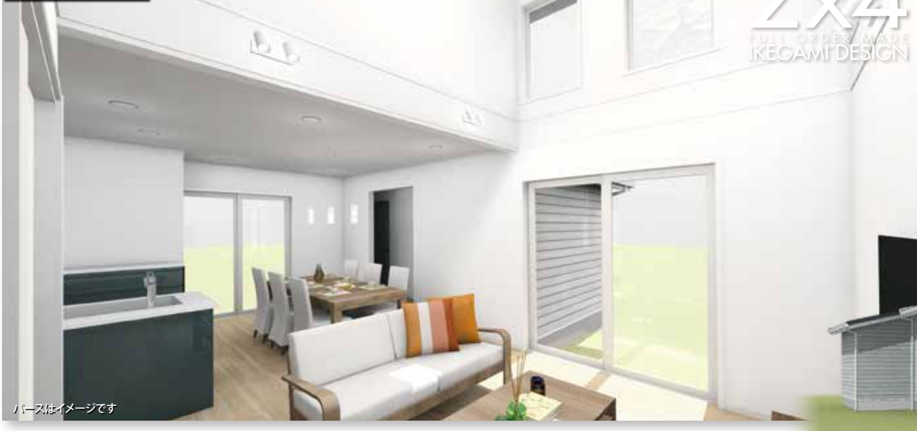
パースはイメージです