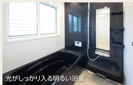
光がしっかり入る明るい浴室