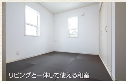
リビングと一体して使える和室