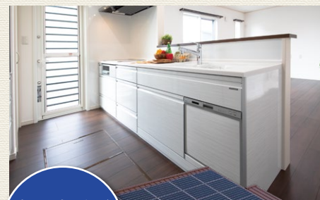
機能的な収納がいっぱい!